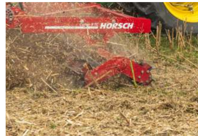
3 ila 18 m arasında çalışma genişliği

En zorlu arazi şartlarında bile güvenli bir kesim sağlamak için makinenin tüm ağırlığı bıçakların üzerindedir. Cultro'nun kullanım yelpazesi, kanola, ayçiçeği, silaj mısır saplarının ve yeşil bitki örtüsü parçalamasını ve isteğe bağlı ağır tırmık ile samanın dağıtılmasını kapsar. Ayrıca, Cultro, Joker ile birlikte tohum yatağı hazırlığı veya çok miktarda organik maddeyi toprağa karıştırmak için kullanılabilir. Ters yönde dönen bıçak başlıkları, organik malzemeyi güvenilir bir şekilde parçalayarak çapraz bir çalışma modeli oluşturur. 300 mm çapındaki küçük boyutu ve her silindirde 6 bıçak bulunması sayesinde yüksek bir dönüş hızı elde edilir, bu da parçalama etkisini daha da güçlendirir. Bıçağın silindir üzerine eğimli bir şekilde yerleştirilmesi, sürekli güç aktarımı sağlar. Bu tasarım, aynı zamanda makinenin sarsılmasını da önler. Maksimum stabilite ve kullanım güvenliği için bıçaklar doğrudan rotora yerleştirilmiştir. Optimal bir toprak uyumu sağlamak için, çift bıçaklar ana gövdeye lastik tampon aracılığıyla sabitlenmiştir. Bu, hareket yönündeki engebeli zemine uyum sağlamayı mümkün kılar ve bıçak silindirini aşırı yüklenmeden korur. Cultro 12 ve 18 TC'de alıcı, RingFlex merdane ve ağır tırmık arasında seçim yapabilir. Cultro 3 TC'de arka montajda bir RollFlex veya RollPack merdane mümkündür. Böylece makine, ilgili çalışma koşullarına en iyi şekilde adapte olabilir.