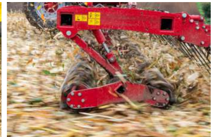
Çift bıçaklı silindir, kesim uzunluğu 14 cm