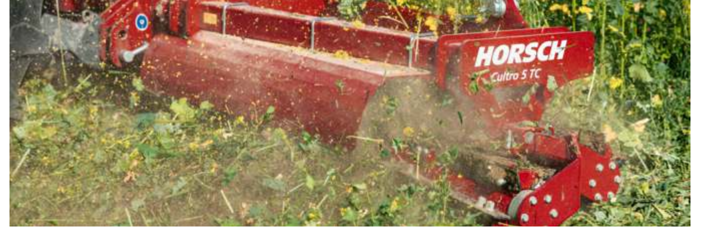
Çift bıçaklı silindir ile ideal parçalama performansı